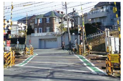
▲踏切内のカラー舗装は東急電鉄により完了。この後、土木事務所により踏切周辺のカラー舗装の工事が行われる。(1/25撮影)