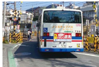
▲約1年前の様子。路線バスのルートでもあり歩行者の安全対策を要望していた。

山中市長からは「カラー舗装を行い、歩行空間を確保する工事を令和4年度内に実施する」と回答がありましたが、1/25現在、歩行空間を確保する工事が進行中で、踏切内のカラー舗装は完了、今後2月中には踏切周辺の道路のカラー舗装の工事が完了する予定と聞いています。